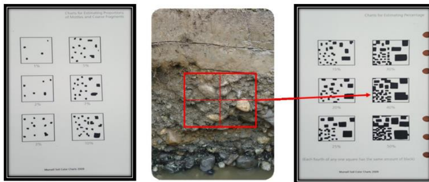
Figura 3. Tipos de fragmentos de roca en el suelo